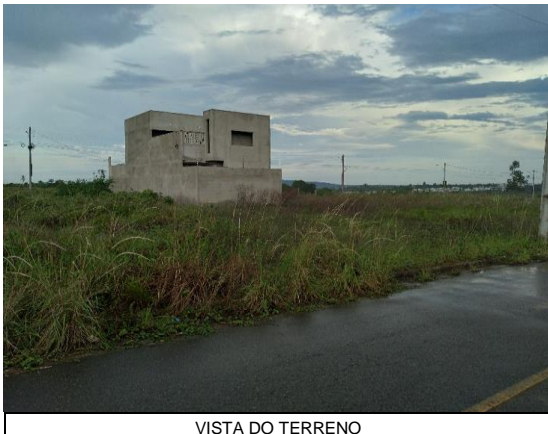
VISTA DO TERRENO