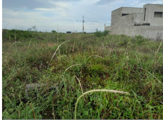
VISTA DO TERRENO