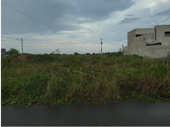
VISTA DO TERRENO