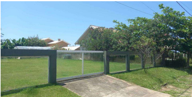
Vizinho à direita