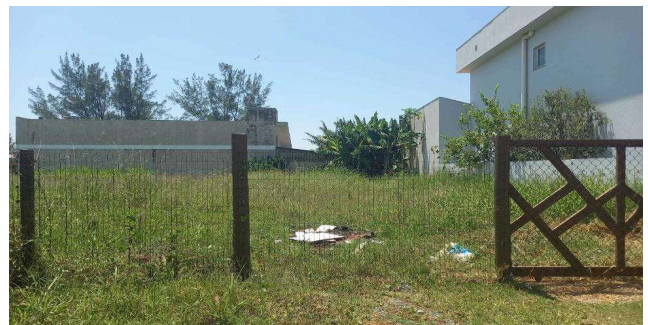
Vizinho à esquerda