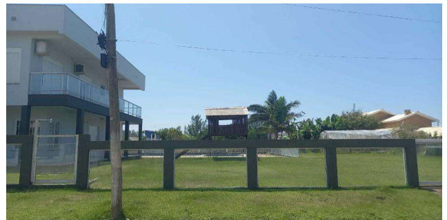
Fachada avaliando - Vista 04