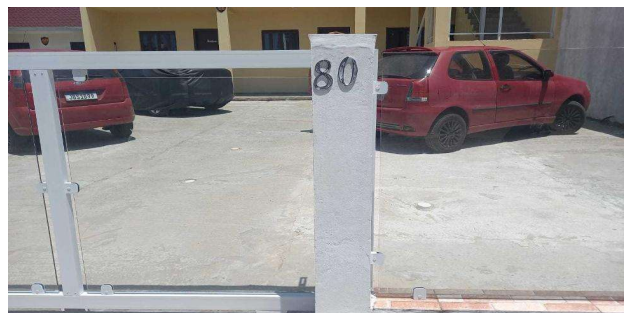
Vizinho frontal - Identificação