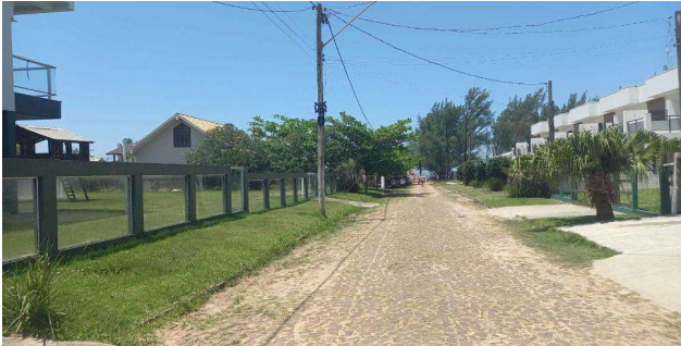
Logradouro - Vista 01