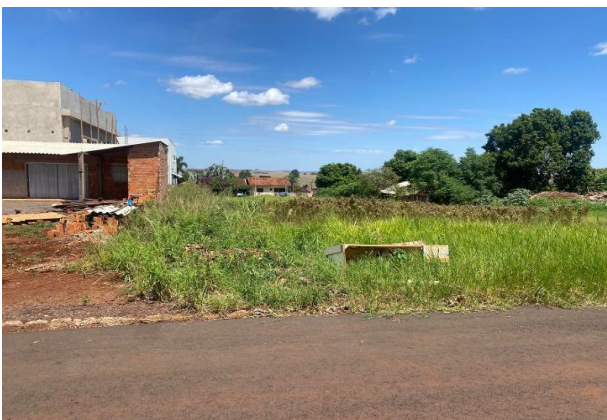
Fachada avaliando - Lote 22A - Vista 02