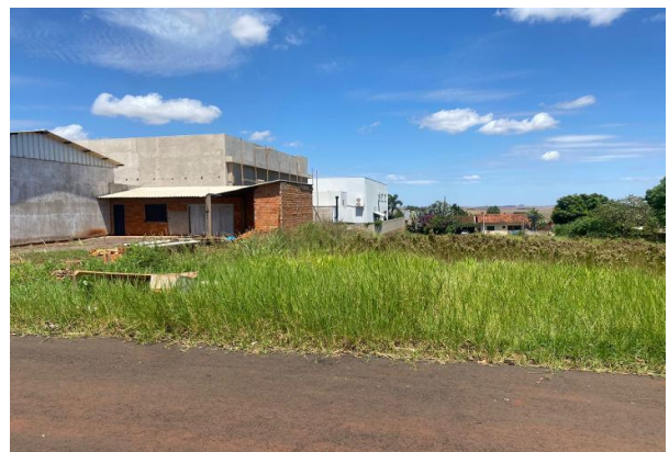
Fachada avaliando - Lote 22A - Vista 03