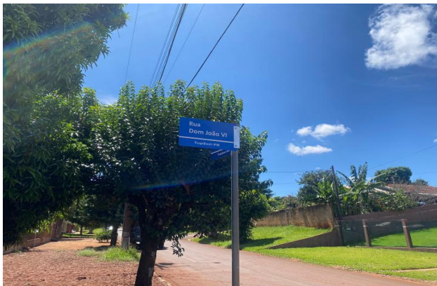
Identificação do logradouro