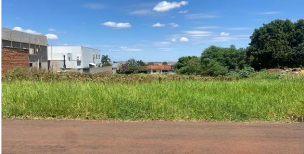
Vizinho à direita - Lote 22