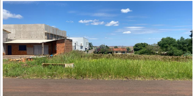
Fachada avaliando - Lote 22A - Vista 01