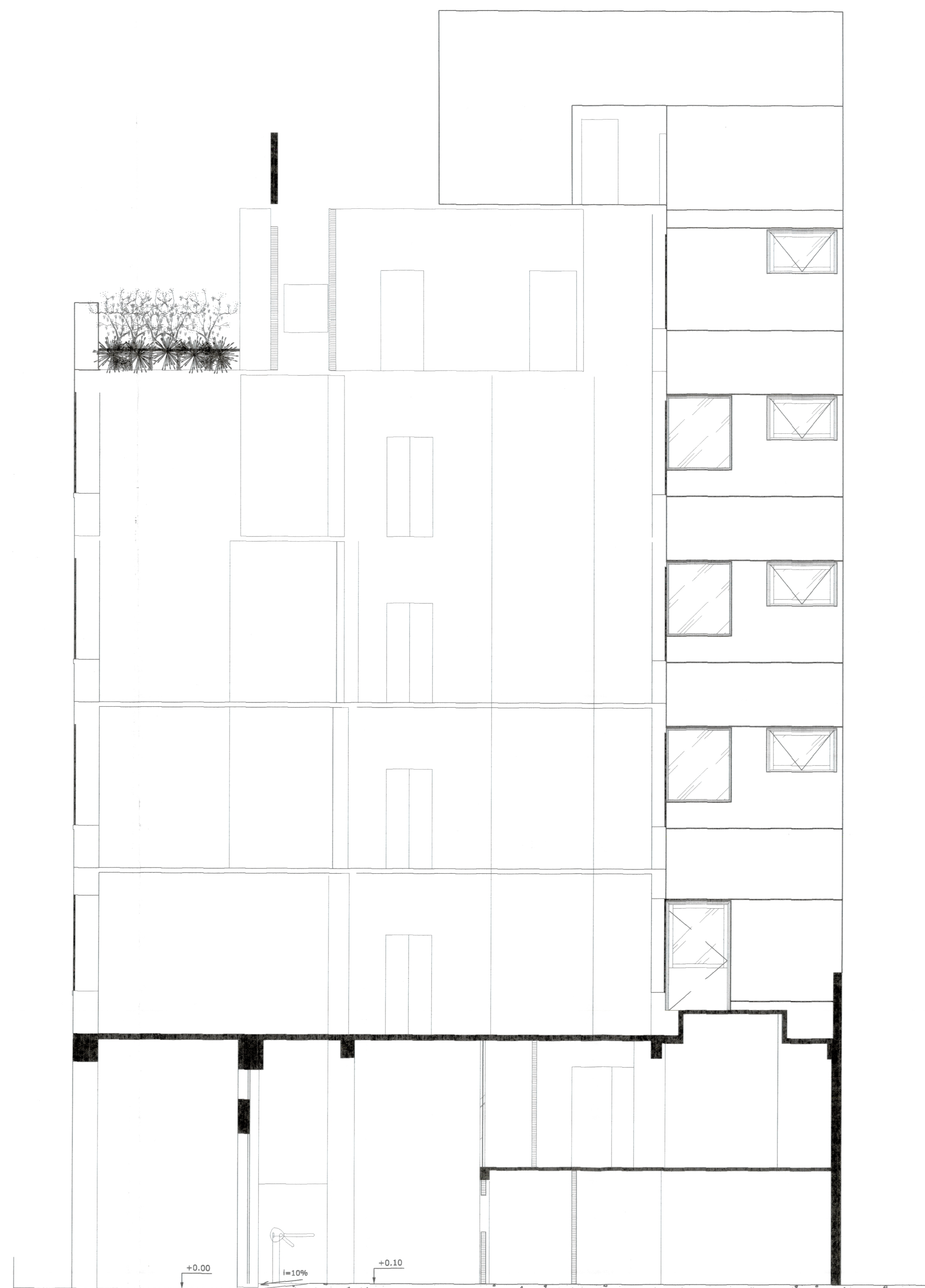
CORTE "BB" esc. 1/50