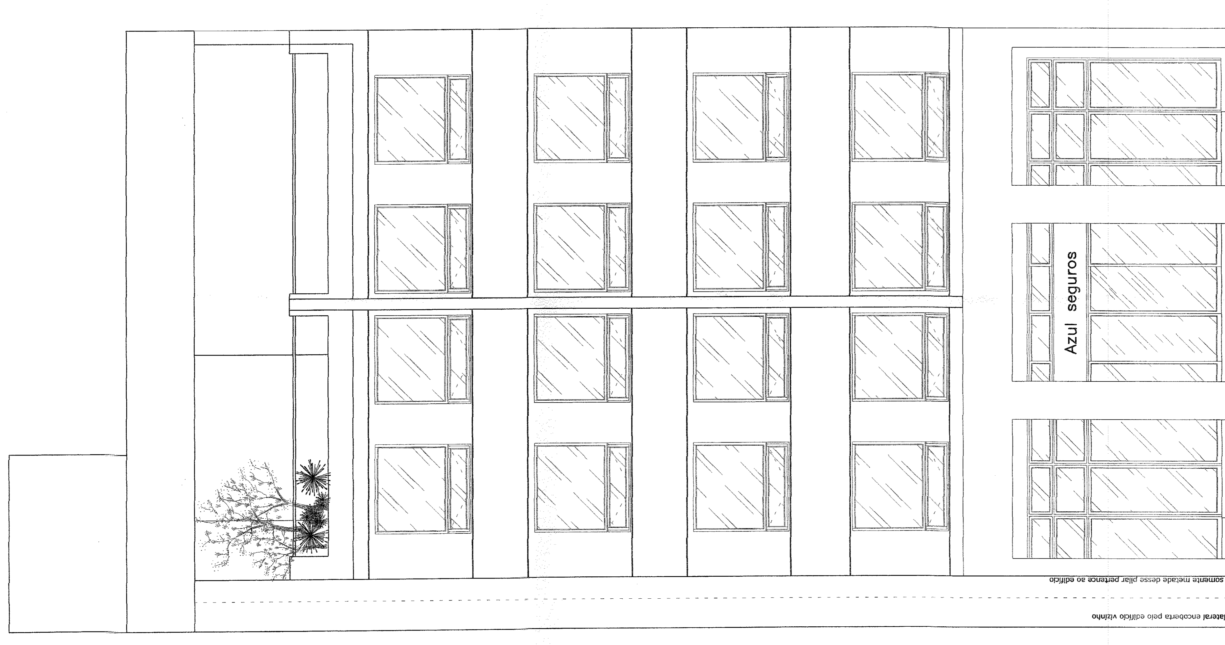
FACHADA FRONTAL esc. 1/50

ARQUITETURA & INSTALAÇÕES PROJETO: 020134/08 AUTOR: M. Damascos FUNDAÇÃO MUNICIPAL DE ENGENHARIA DEBEN/PROJ 13284/1318