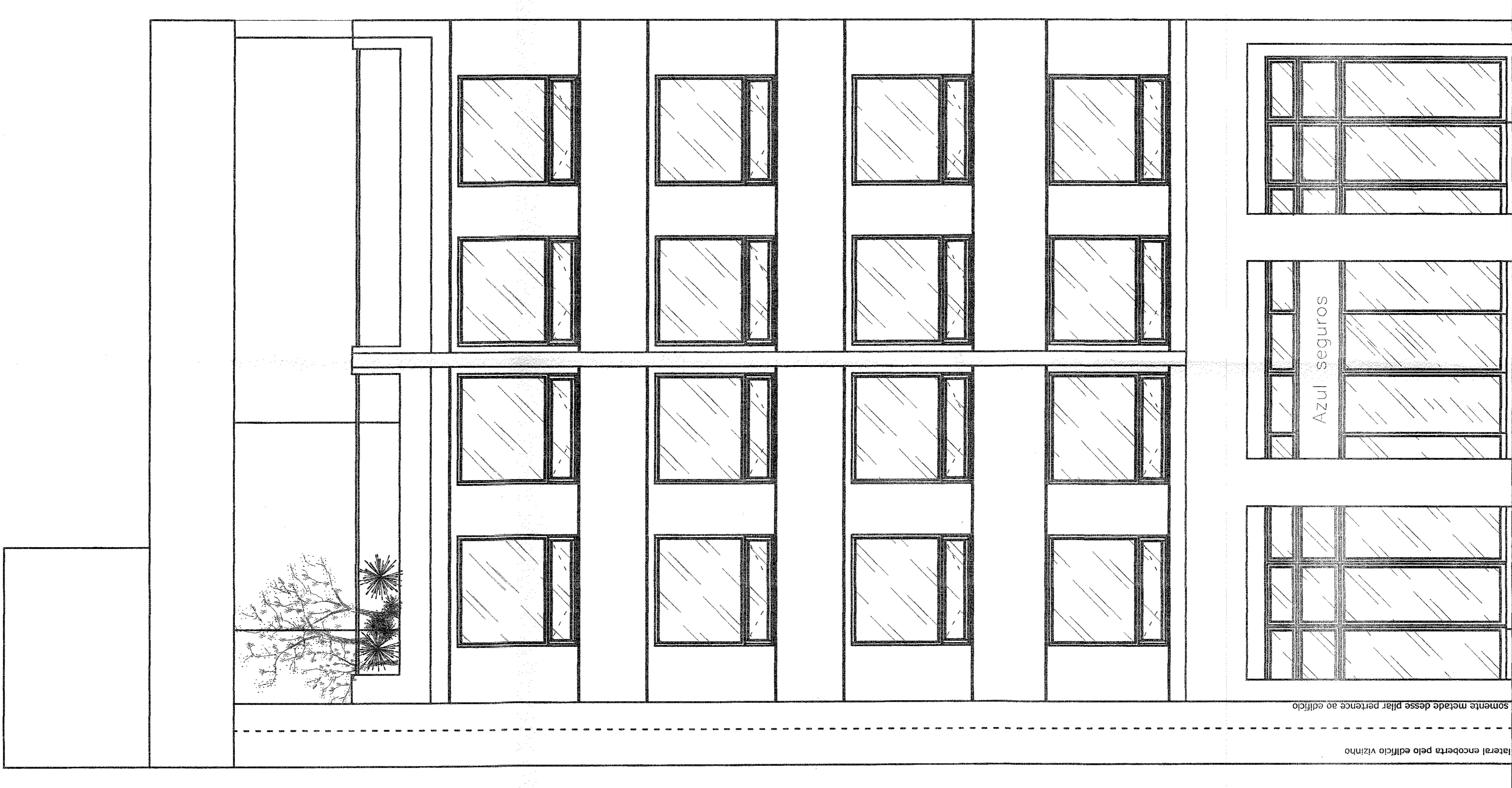
FACHADA FRONTAL esc. 1/100

PROJETO PARA MODIFICAÇÃO INTERNA EM PRÉDIO EXISTENTE SEM ACRESCIMO DE ÁREA A RUA DA ALFANDEGA Nº21-CENTRO-RJ