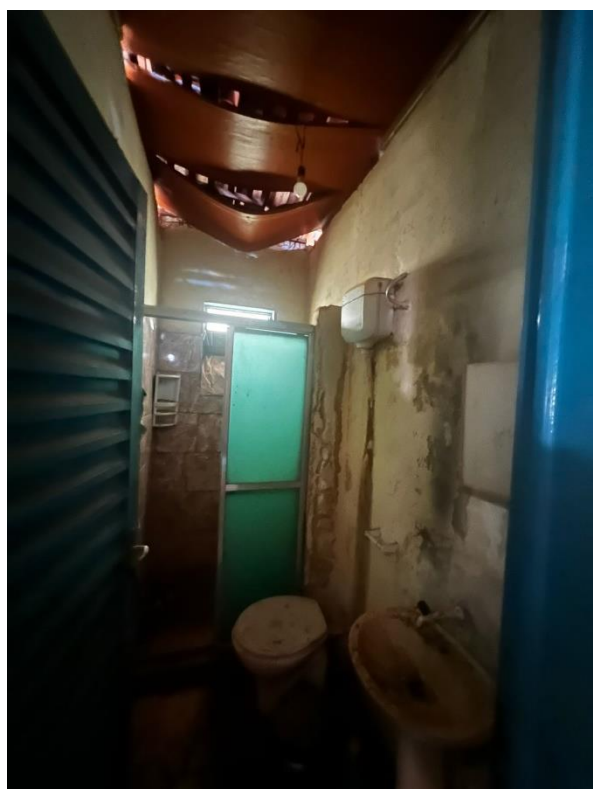
➤ Banheiro social