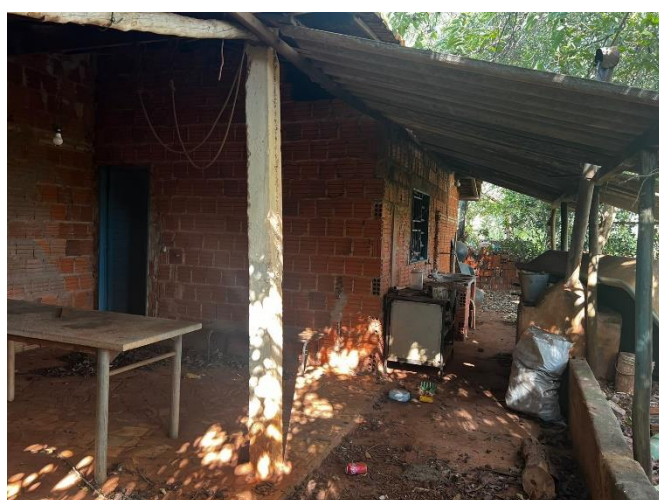
➤ Varanda com lavanderia coberta com telha de eternit