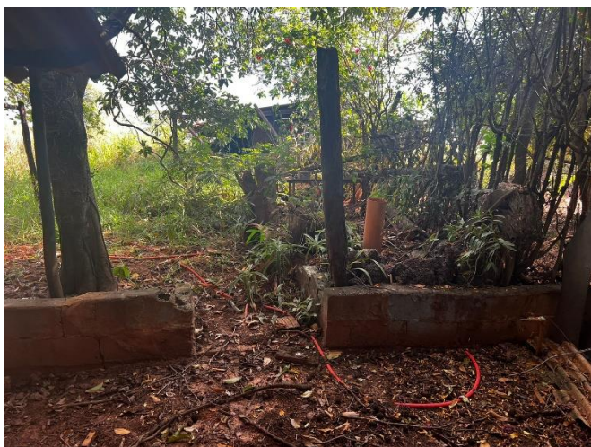
➤ Quintal com mato alto