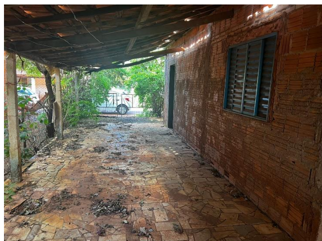
➤ Garagem com cobertura