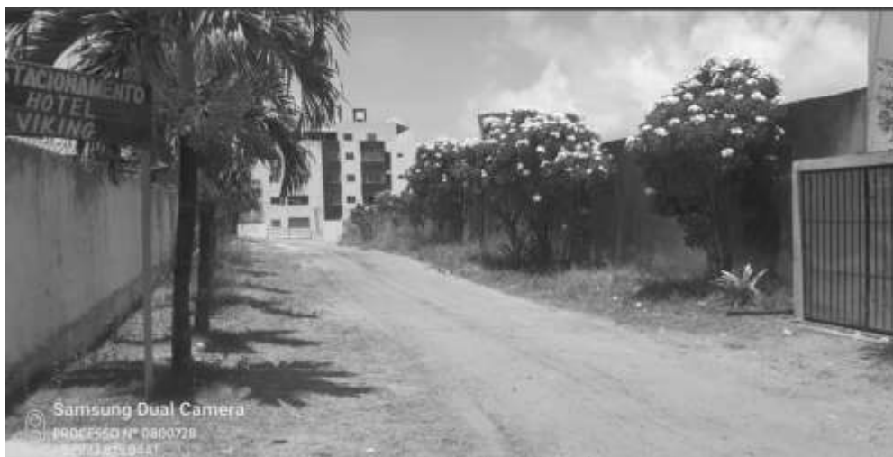
Imagem frente dos lotes 06 e 07 da Quadra E-10, Loteamento "CIDADE BALNEÁRIO NOVO MUNDO", Conde/PB, RUA KARIN GUNILLA ORNESTRAND