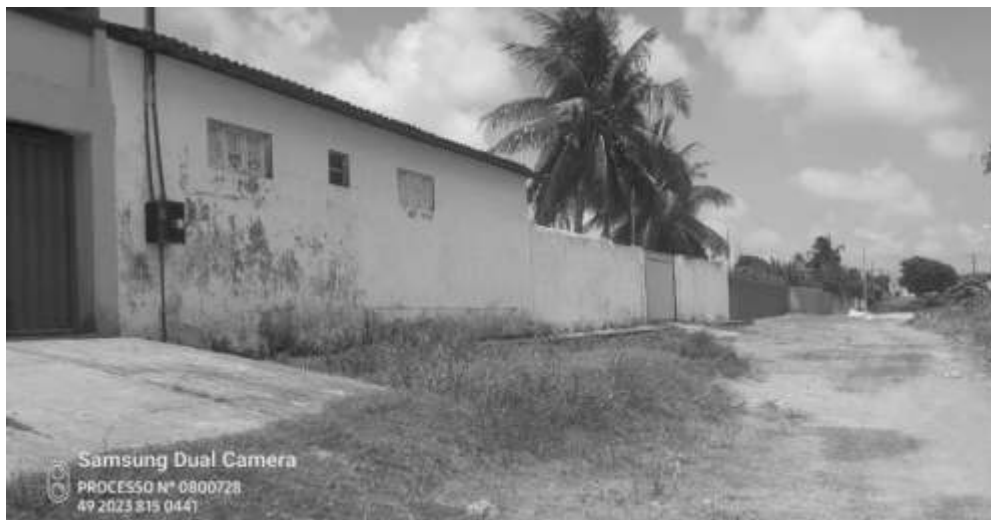
Imagem frente dos lotes 05 e 04 da Quadra E-10, Loteamento "CIDADE BALNEÁRIO NOVO MUNDO", Conde/PB, RUA DAS MOÇAS