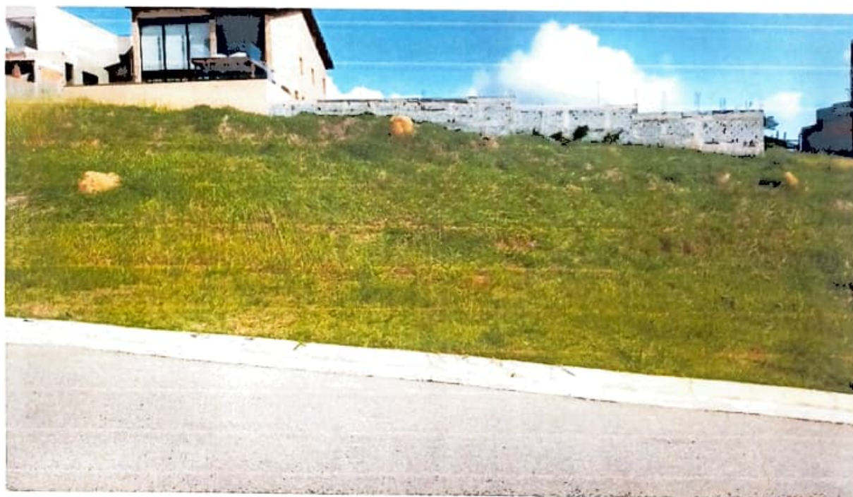
Figura 1 Terreno residencial em aclave Quadra 13, Lote 50 – Altavis

Terreno se encontra bem situado, com vista para as montanhas e em local bem ensolarado, topografia em aclave e de fácil acesso. Não consta nenhuma alteração em sua topografia, como escavação ou qualquer outra ocorrência provocada pela ação humana, ou não, e que venha a servir de fator de depreciação.