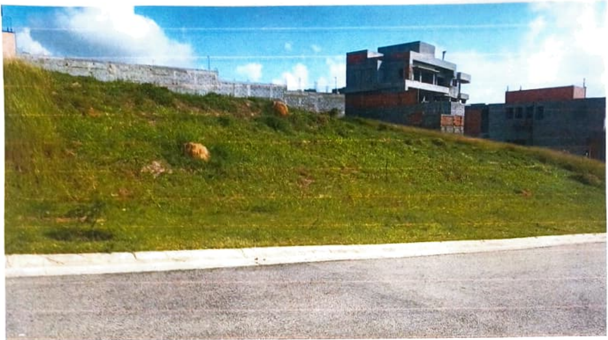
Figura 2 Terreno residencial em aclive Quadra 13, Lote 50 – Altavis

Levamos em conta alguns fatores para chegarmos no valor aproximado, como: oferta e demanda atual de mercado, metragem do terreno, localização, bem como as características gerais do imóvel, e chegamos no valor médio de venda de R$537.875 (quinhentos e trinta e sete mil, oitocentos e setenta e cinco reais) .