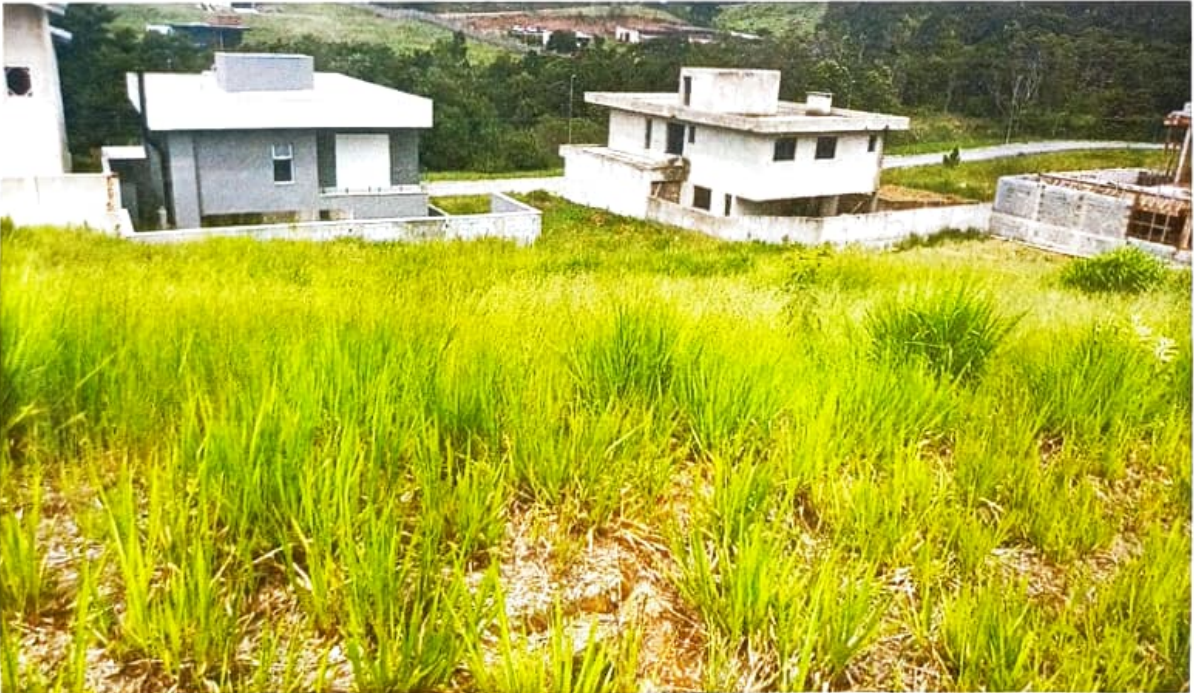
Figura 1 Altavis quadra 20, lote 23

Terreno se encontra bem situado em local bem ensolarado, topografia em declive de fundo e lateral e de fácil acesso. Não consta nenhuma alteração em sua topografia, como escavação ou qualquer outra ocorrência provocada pela ação humana, ou não, e que venha a servir de fator de depreciação.