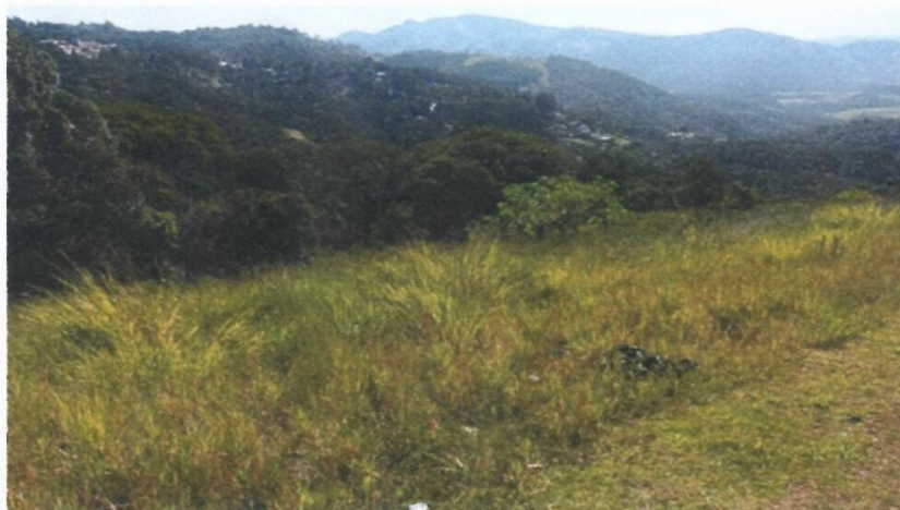
Figura 1 Terreno residencial em declive, Lote 05 Quadra 11 – Altavis

Terreno se encontra bem situado, com vista para a área verde, pertencente ao Residencial, e em local bem ensolarado, topografia em declive e de fácil acesso. Não consta nenhuma alteração em sua topografia, como escavação ou qualquer outra ocorrência provocada pela ação humana, ou não, e que venha a servir de fator de depreciação.